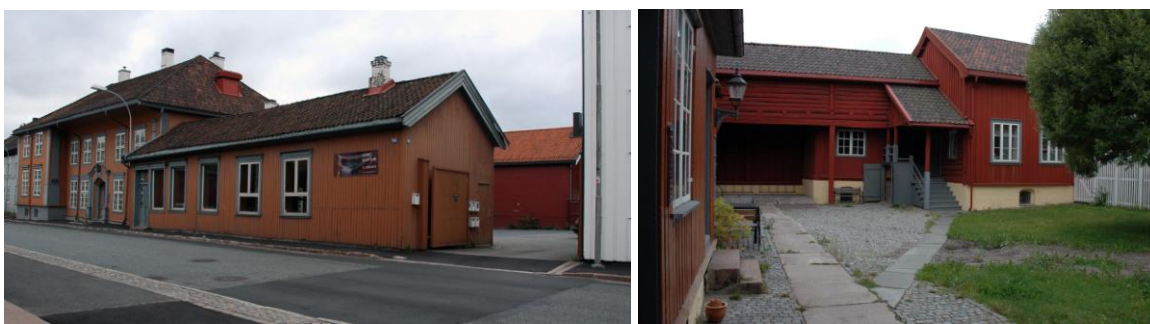
Cappelengården, med Drengestua. Inngangen til kjelleren er midt på bildet til høyre.

Det er en del parkeringsplasser inne i gården som fritt kan benyttes. Alle plasser merket Reservert og Gjester kan brukes, men ikke de 3 plassene det står navn på. Innerst i gården, gjennom en svalgang, finner du Drengestua.